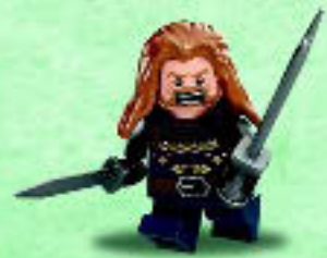
□ 79018 Fili the Dwarf Le nain Fili Fili el Enano