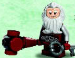
□ 79018 Balin the Dwarf Le nain Balin Balin el Enano