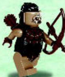
□ 79016 Hunter Orc Orque chasseur Orco Cazador