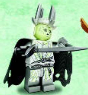
□ 79015 Witch-king Roi-Sorcier Rey Brujo