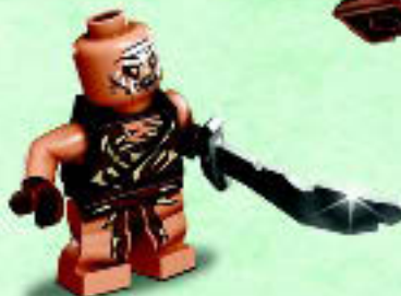
□ 79017 Gundabad Orc