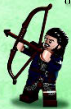
□ 79017 Bard the Bowman™