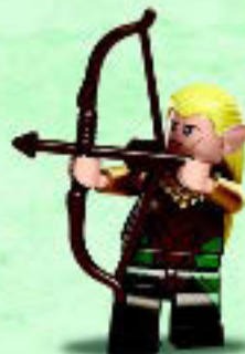
□ 79017 Legolas Greenleaf™