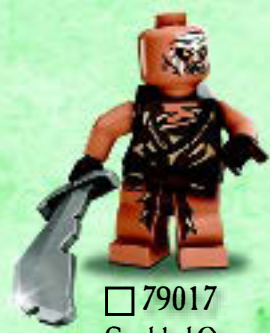
□ 79017 Gundabad Orc Orque de Gundabad Orco de Gundabad