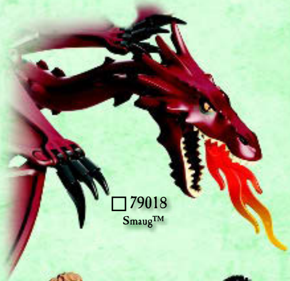
□ 79018 Smaug™