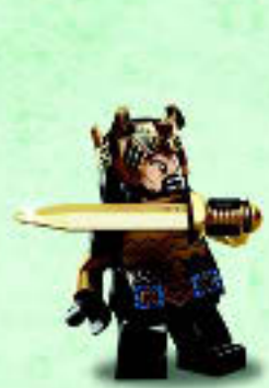
□ 79017 Thorin Oakenshield™