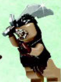
□ 79016 Hunter Orc Orque chasseur Orco Cazador