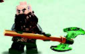
□ 79018 Dwalin the Dwarf Le nain Dwalin Dwalin el Enano