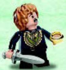
□ 79018 Bilbo Baggins™