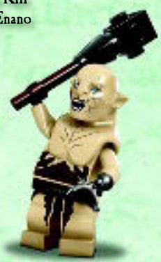
□ 79017 Azog™