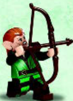
□ 79016 Tauriel™