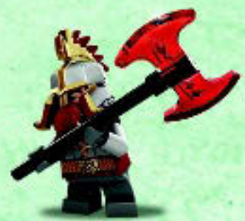
□ 79017 Dain Ironfoot Dain Pied d'Acier Dain Pie de Hierro