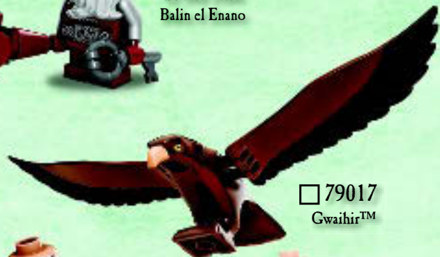
□ 79017 Gwaihir™