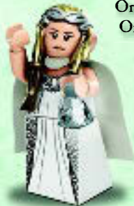
□ 79015 Galadriel™