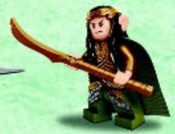
□ 79015 Elrond™