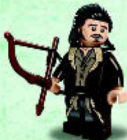
□ 79016 Bard the Bowman™