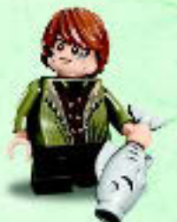
□ 79016 Bain son of Bard Bain fils de Bard Bain hijo de Bard