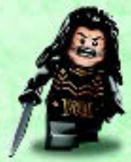
□ 79018 Kili the Dwarf Le nain Kili Kili el Enano